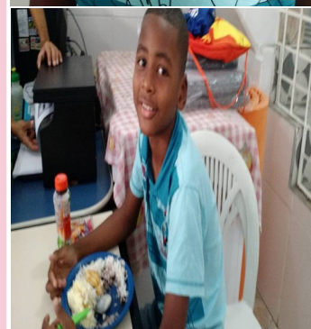
Creche mantida pela